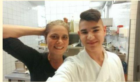
Sarah Wiener und Tuncay im Restaurant (Sarah Wiener Restaurant im Hamburger Bahnhof)