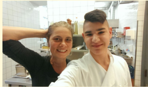
Sarah Wiener und Tuncay im Restaurant (Sarah Wiener Restaurant im Hamburger Bahnhof)